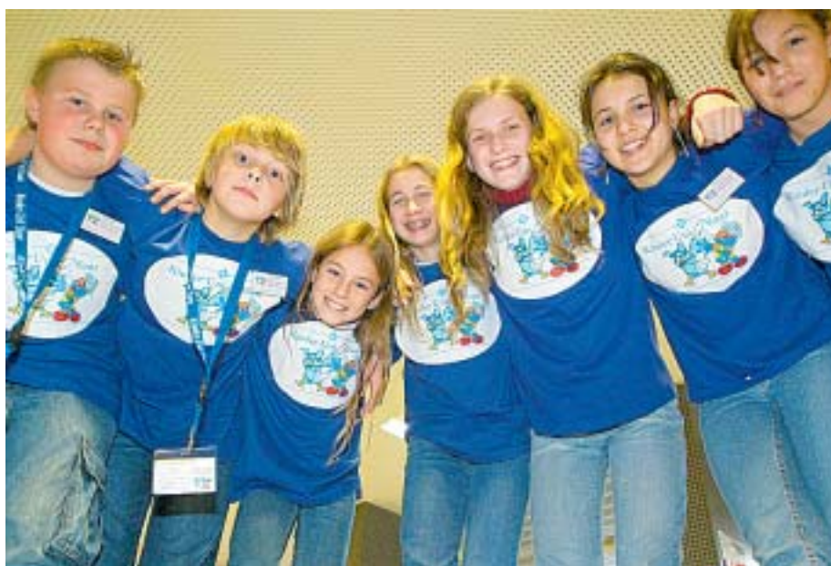
Diese fröhliche Schar von Schülern des Gymnasiums am Rotenbühl drückten bei der Kinder-Uni Stempel in die Studentenausweise.