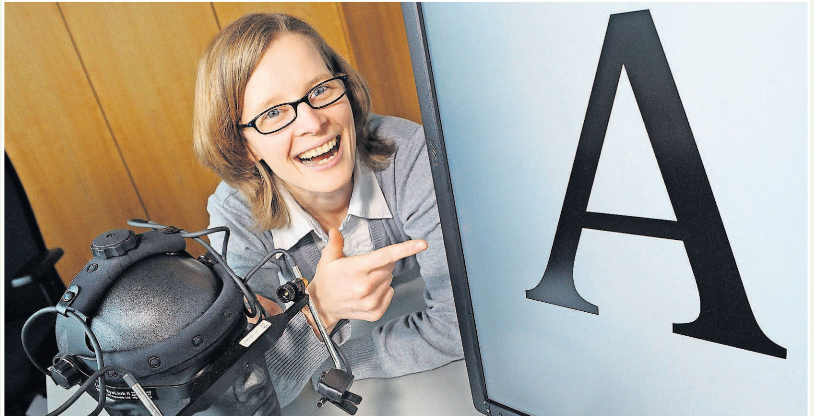
In ihrer Vorlesung am 6. Mai wird Vera Demberg mit den Studenten der Saarbrücker Kinder-Uni Sprache erforschen.

ran, dass jeder, der Deutsch spricht, den Aufbau dieser Sprache beherrscht. Wie das Grundgerüst einer Sprache aussieht und wie sie im Gehirn abgespeichert wird, erforschen Sprachwissenschaftler wie Vera Demberg von der Saar-Universität. Sie wird in ihrer Vorlesung bei der Kinder-Uni aufregende Experimente machen, in denen ihr beobachten könnt, was im Ge-