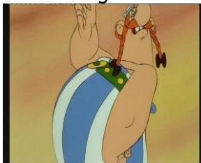
Asterix Sieg über Caesar

Dann habt Ihr gesehen, wie der Schnitt im Zeichentrickfilm und im richtigen Film funktioniert, wenn die Bilder nicht auf einander folgen, wie im Daumenkino, sondern sich plötzlich verändern, weil etwas herausgeschnitten ist: