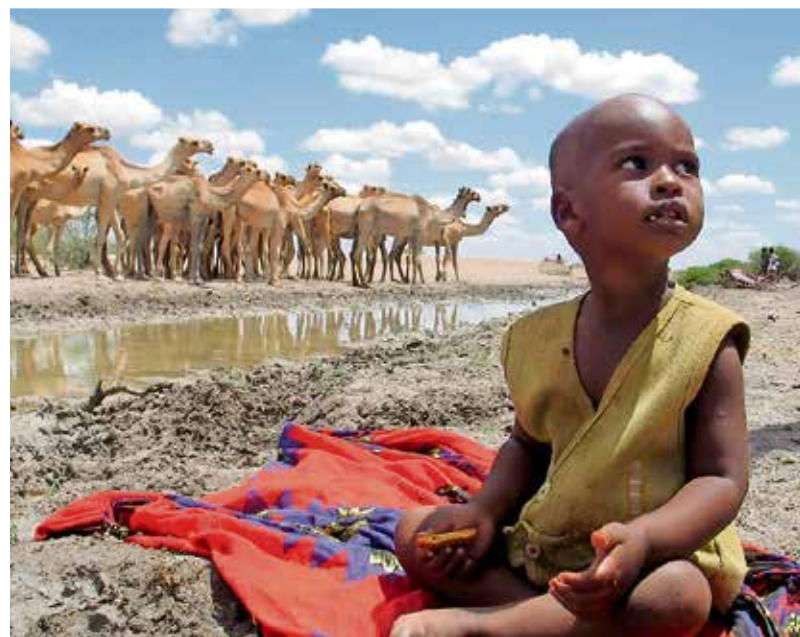
Vor allem Menschen in ärmeren Ländern werden die Folgen des Klimawandels erleiden, auch wenn sie am wenigsten dazu beigetragen haben.